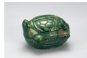
【7】交趾大亀香合 中国・明時代 17世紀 根津美術館蔵