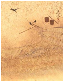
【5-2】 【後期展示】 漆絵画帖 波汐汲図 柴田是真作 江戸～明治時代 19世紀 個人蔵