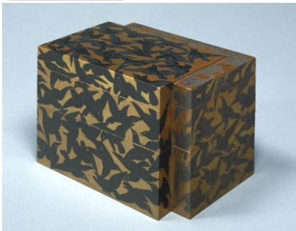
【1】鳥鷺蒔絵菓子器 柴田是真作 江戸～明治時代 19世紀 東京国立博物館蔵