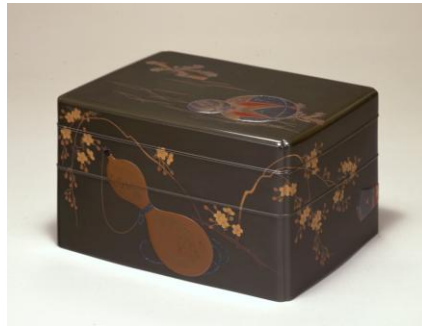
【2】五節句蒔絵手箱 柴田是真作 江戸～明治時代 19世紀 サントリー美術館蔵(東京) 【後期展示】