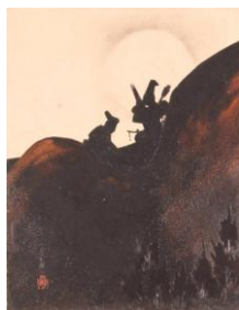
【5-1】 【前期展示】 漆絵画帖 足柄山図 柴田是真作 江戸～明治時代 19世紀 個人蔵