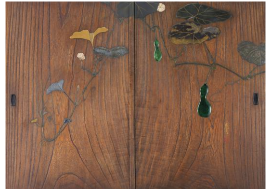
【3】夕顔蒔絵板戸 柴田是真・三浦乾也合作 江戸～明治時代 19世紀 根津美術館蔵