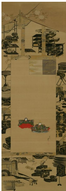
【4】雛図 柴田是真作 日本～明治時代 19世紀 根津美術館蔵 【前期展示】