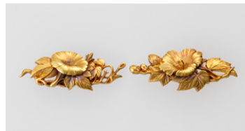
【2】 芙蓉朝顔図目貫 吉田至永作 日本・明治時代 19-20世紀 根津美術館蔵 (光村利藻旧蔵)