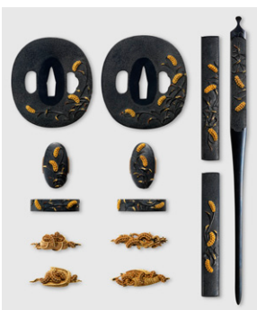
【5】 粟穂図大小揃金具 荒木東明作 日本・江戸時代 19世紀 個人蔵(光村利藻旧蔵)