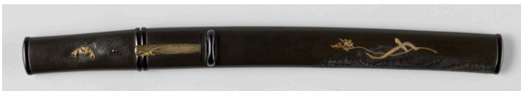
【3】 波葦蔦総合口拵 加納夏雄・柴田是真合作 日本・江戸時代 19世紀 根津美術館蔵 (光村利藻旧蔵)