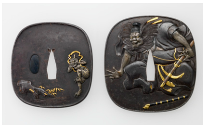
【1】 鍾馗鬼図大小鐺 松尾月山作 日本・江戸～明治時代 19世紀 根津美術館蔵 (光村利藻旧蔵)