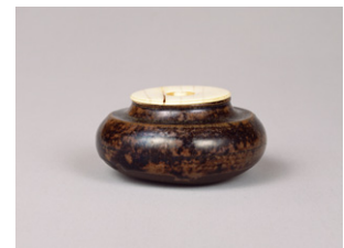
【7】 大海茶入 銘節季 瀬戸 日本・室町時代 16世紀 根津美術館蔵