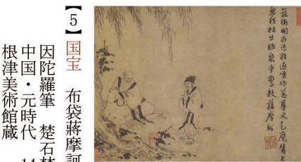
【5】国宝 布袋蔣摩訶問答図 因陀羅筆 楚石梵琦賛 中国・元時代 14世紀 根津美術館蔵