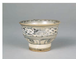
【8】安南染付菊唐草文茶碗 銘 童子 ヴェトナム 15世紀 根津美術館蔵