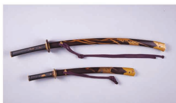
【6】雁稻穂蒔絵大小拵 江戸~明治時代 19世紀 1対 根津美術館蔵