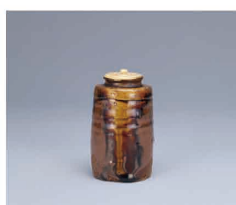
【7】利休瀬戸茶入 銘 一夜 瀬戸 日本・桃山時代 16世紀 根津美術館蔵