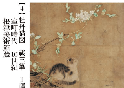
【4】牡丹猫図 蔵三筆 1幅 室町時代 16世紀 根津美術館蔵