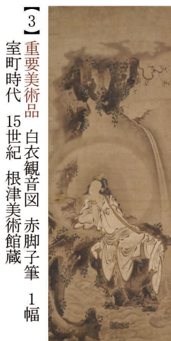
【3】重要美術品 白衣観音図 赤脚子筆 1幅 室町時代 15世紀 根津美術館蔵