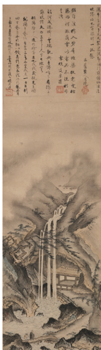
【1】重要文化財 観瀑図 芸阿弥筆 月翁周鏡ほか2僧賛 日本・室町時代 文明12年(1480) 根津美術館蔵

■ 広報画像をデータでご用意しております。ご希望の写真番号に○を付けてください。