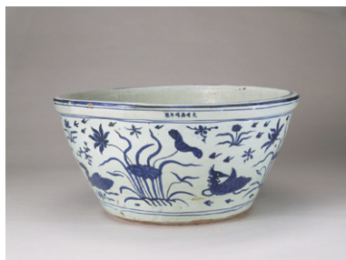
【3】青花蓮池水禽文水甕 景德鎮窯 中国・明時代 嘉靖年間(1522-1566) 根津美術館蔵