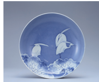
【4】染付白鷺文皿 肥前 日本・江戸時代 17世紀 山本正之氏寄贈 根津美術館蔵