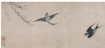
【5】柳燕図 単庵智伝筆 日本・室町時代 16世紀 根津美術館蔵