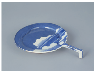
【2】染付雪柴垣文団扇形皿 肥前 日本・江戸時代 17世紀 山本正之氏寄贈 根津美術館蔵