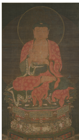
【6】重要文化財 阿弥陀如来像 絹本着色 朝鮮・高麗時代 大徳10年 (1306)根津美術館蔵