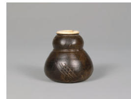
【8】瓢形茶入 銘 空也 新兵衛作 瀬戸 日本・江戸時代 17世紀 根津美術館蔵