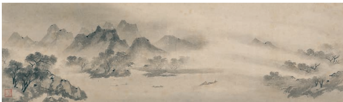
国宝 漁村夕照図 牧谿筆 中国・南宋時代 13世紀

墨に託された画家のこころや禅僧の精神にじかに触れていただけるまたとない機会です。