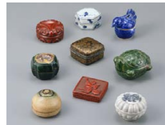
[4] 香合各種 根津美術館蔵