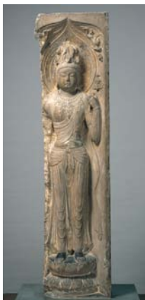
重要文化財 じゅういちめんかんのんりょうぞうがん 十一面観音立像龕 中国・唐時代 7世紀