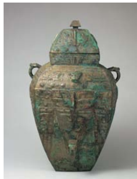
重要文化財 とうてつもんほうらい 饗養文方壺 中国・殷時代 前13-12世紀

世界的なコレクションを誇る、中国殷周時代の青銅器を中心に、青銅器のために特別に設計された照明とケースでご覧いただけます。