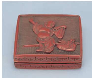
ついでほていこうごう 堆朱布袋香合 中国・明時代 16～17世紀