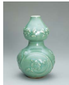
せいじうきぼたんもんひきごがたはなけ 青磁浮牡丹文瓢形花生 中国・南宋～元時代 14世紀

「見わたせば柳桜をこきまぜて 都ぞ春の錦なりける」 とうたわれた日本の春、開花を祝う花見の茶会取り合わせをご紹介します。