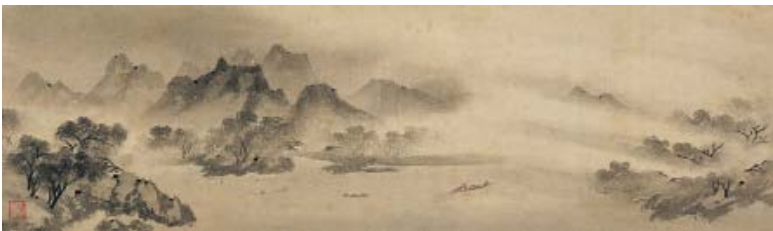
[1] 国宝 漁村夕照図 牧谿筆 中国・南宋時代 13世紀 根津美術館蔵