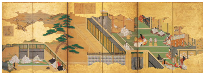
【1】源氏物語図屏風(右隻) 住吉具慶筆 6曲1双 紙本着色 日本・江戸時代 17世紀 根津美術館蔵

■ 広報画像をデータでご用意しております。ご希望の写真番号に○を付けてください。