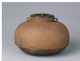
【6】責紐釜 1口 天明 鉄 日本・室町～桃山時代 16世紀 根津美術館蔵