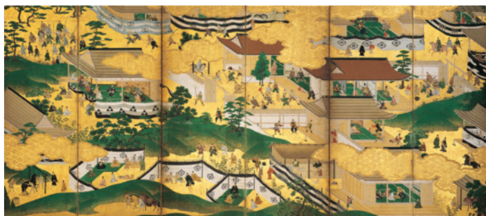
【2】曾我物語図屏風(左隻) 6曲1双 紙本着色 日本・江戸時代 17世紀 根津美術館蔵