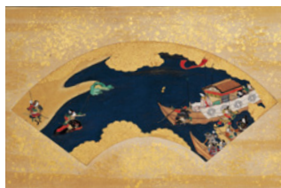
【4】平家物語画帖 3帖のうち(部分) 紙本着色 日本・江戸時代 17世紀 根津美術館蔵