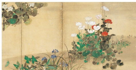
四季草花図屏風 喜多川相説筆 日本・江戸時代 17世紀 根津美術館蔵