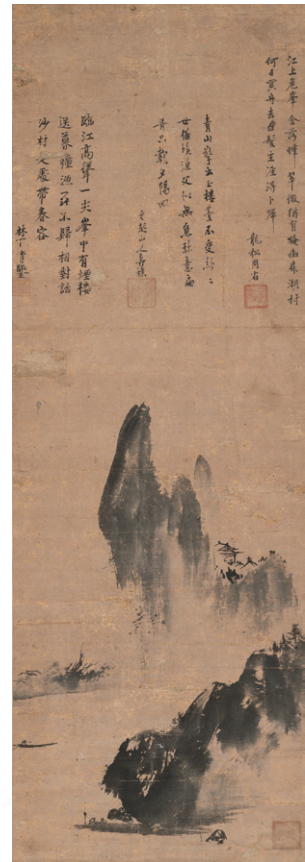
重要文化財 はつぼくさんすいず いさんしゅうしょう 澗墨山水図 拙宗等揚筆 以参周省賛 1幅 紙本墨画 日本・室町時代 15世紀 正木美術館蔵

ろば 驢馬に乗る人物や梅の枝ぶり、木立に囲まれた建物など、個々のモチーフは雪舟時代の作品にも踏襲される。しかしそれらを構成する力は、この時期にはまだ不足しているようだ。