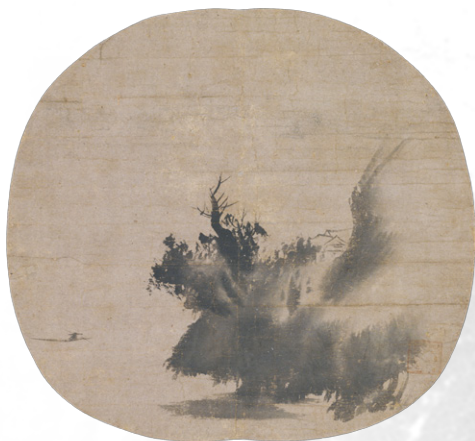
はつぼくさんすいず 拙宗等揚筆 澗墨山水図 拙宗等揚筆 1幅 紙本墨画 日本・室町時代 15世紀 根津美術館蔵 茂木克己氏寄贈

ダイナミックな筆の動きで岩山を形作る技法は、雪舟時代の最晩年まで踏襲された。賛者の以参周省は内大教弘の子で、拙宗の京都から山口への移住に関与したと目される禅僧。