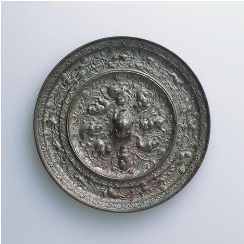
海獣葡萄鏡 1面 青銅 中国・唐時代 7世紀 根津美術館蔵 村上英二氏寄贈

唐時代には、西アジアに起源をもつ文様が鏡に多く取り入れられた。本作の文様はいずれも西方由来で、海獣とは西方の獅子の影響を受けた狻猊という獣のこと。唐草の葡萄は多産・豊穡・子孫繁栄を象徴する。