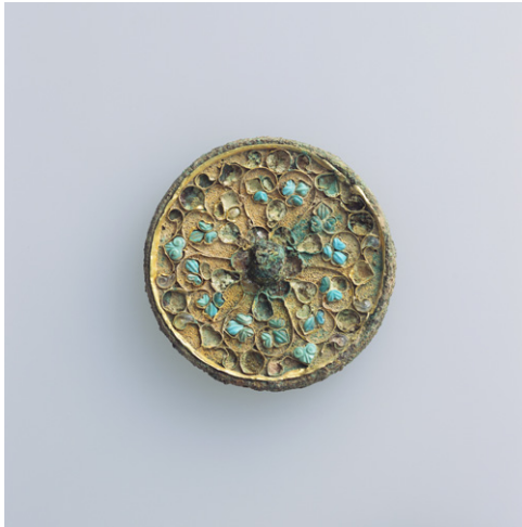
貼金緑松石象嵌花唐草文鏡 1面 青銅 中国・唐時代 8世紀 根津美術館 村上英二氏寄贈

唐時代には、西アジアに起源をもつ文様が鏡に多く取り入れられた。本作の文様はいずれも西方由来で、海獣とは西方の獅子の影響を受けた狻猊という獣のこと。唐草の葡萄は多産・豊穡・子孫繁栄を象徴する。