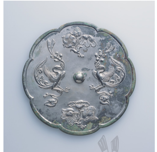
双鳳瑞花八花鏡 1面 青銅 中国・唐時代 8世紀 根津美術館 村上英二氏寄贈

鏡背にごく薄い金板をはめ込み、瑞花をあらわす。トルコ石を嵌め込み、地の部分を隙間なく金の細粒で満たした珍しい鏡である。