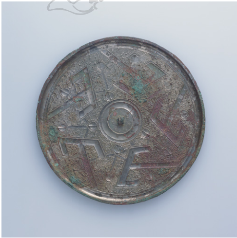
星雲鏡 1面 青銅 中国・前漢時代 前1世紀 根津美術館蔵 村上英二氏寄贈

漢字の「山」に似た文様を配した鏡を「山字文鏡」とよぶ。山字文は青銅祭器の文様からモチーフを転用したといわれる。