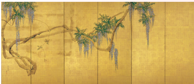
【1】重要文化財 藤花図屏風(左隻) 円山応挙筆 日本・江戸時代 安永5年(1776) 根津美術館蔵