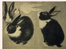
【5】重要文化財 写生図巻 円山応挙筆 2巻のうち 日本・江戸時代 明和7年～安永元年(1770～72) 株式会社千總蔵 *会期中巻替えあり