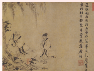
【6】国宝 布袋蔣摩訶問答図 因陀羅筆・楚石梵琦賛 中国・元時代 14世紀 根津美術館蔵