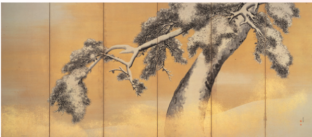
【2】国宝 雪松図屏風(右隻) 円山応挙筆 日本・江戸時代 天明6年(1786)頃 三井記念美術館蔵 *前期(11/3-11/27)展示