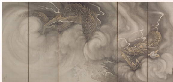
【3】重要文化財 雲龍図屏風(左隻) 円山応挙筆 日本・江戸時代 安永2年(1773) 個人蔵 *後期(11/29-12/18)展示