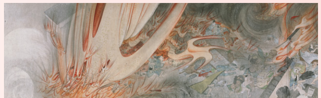
【4】重要文化財 七難七福図巻 円山応挙筆 3巻のうち 日本・江戸時代 明和5年(1768) 相国寺蔵 *会期中巻替えあり