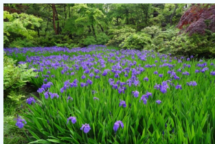
【7】根津美術館 庭のカキツバタ