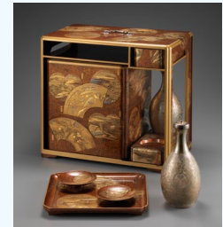
【5】梨地謡寄蒔絵提重 日本・江戸時代 19世紀 根津美術館蔵