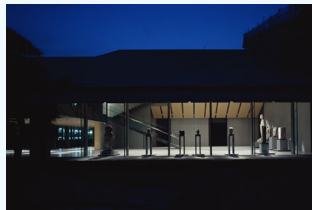
【8】根津美術館 夜間開館