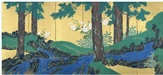
【2】夏秋溪流図屏風(右隻) 鈴木其一筆 6曲1双 日本・江戸時代 19世紀 根津美術館蔵