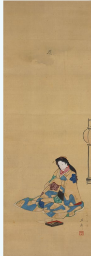
【3】高尾大夫・吉原通船図(右幅) 歌川広重筆 2幅 日本・江戸時代 19世紀 根津美術館蔵