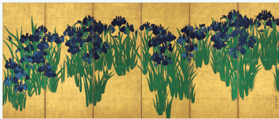
【1】国宝 燕子花図屏風(右隻) 尾形光琳筆 6曲1双 日本・江戸時代 18世紀 根津美術館蔵