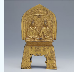
【4】重要文化財 釈迦多宝二仏並坐像 中国・北魏時代 太和13年(489) 根津美術館蔵