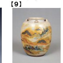
【9】 重要文化財 色絵山寺図茶壺 野々村仁清作 江戸時代 17世紀 根津美術館蔵