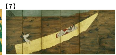
【7】 浮舟図屏風 六曲一隻 江戸時代 17世紀 根津美術館蔵