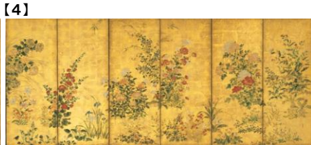
【4】 四季草花図屏風(右隻) 伊年印 江戸時代 17世紀 根津美術館蔵