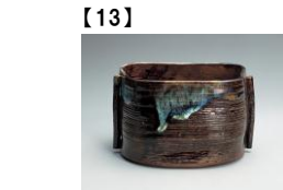
【13】 管耳四方水指 高取 江戸時代 17世紀 根津美術館蔵