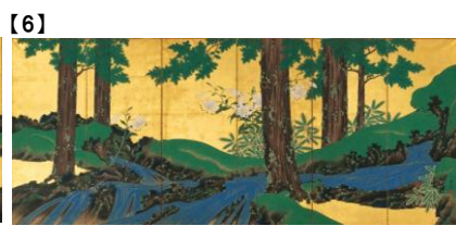
【6】 夏秋溪流図屏風<右隻> 鈴木其一筆 江戸時代 19世紀 根津美術館蔵