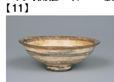
【11】 三鳥茶碗 銘 上田 高麗茶碗 朝鮮・朝鮮時代 15-16世紀 根津美術館蔵