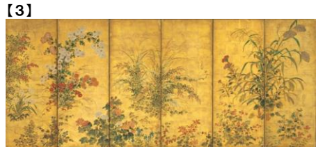
【3】 四季草花図屏風(左隻) 伊年印 江戸時代 17世紀 根津美術館蔵