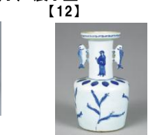
【12】 古染付鯉耳花生 景德鎮窯 中国・明時代 17世紀 根津美術館蔵