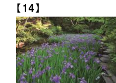
【14】 茶室「弘仁亭」前のカキツバタ 根津美術館蔵