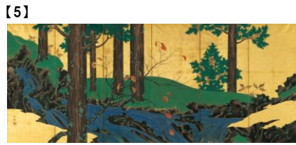
【5】 夏秋溪流図屏風(左隻) 鈴木其一筆 江戸時代 19世紀 根津美術館蔵