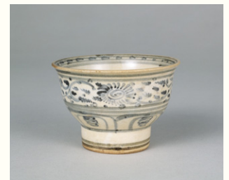
【6】 安南花唐草文茶碗 銘 童子 ヴェトナム 15-16世紀 根津美術館蔵