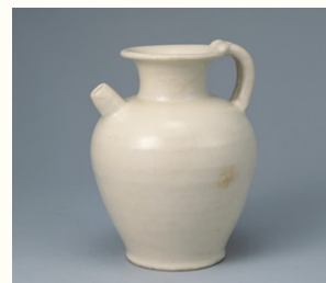
【5】 白磁水注 中国・唐時代 9世紀 根津美術館蔵 藤崎隆三氏寄贈