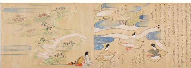
【4】 伊勢物語絵巻 3巻(部分) 日本・室町時代 16世紀 個人蔵