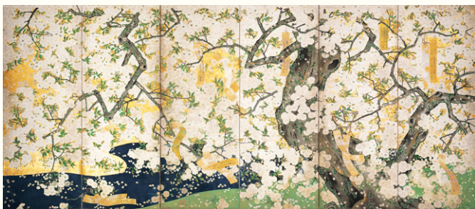
【3】 吉野龍田図屏風(右隻) 6曲1双 日本・江戸時代 17世紀 根津美術館蔵