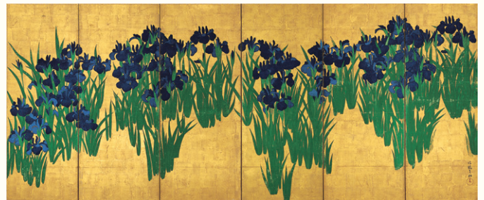
【2】 国宝 燕子花図屏風(右隻) 尾形光琳筆 6曲1双 日本・江戸時代 18世紀 根津美術館蔵