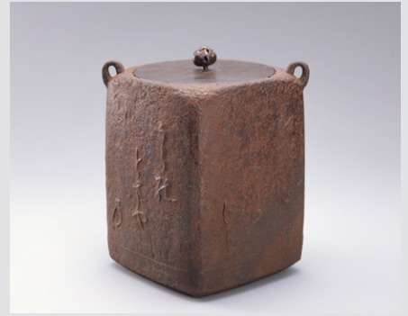
こてんみょうじゅうおうぐちがま 古天明十王口釜 1口 鑄鉄 日本・室町時代 16世紀 根津美術館蔵

柔らかく角を面取りして四方にした釜は、利休好みと言われている。胴の各面には「新古今和歌集」の藤原定家の歌を鑄出している。