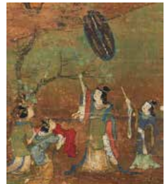
【4】重要文化財 釈迦八相図（部分） 日本・鎌倉時代 13世紀 MOA美術館蔵