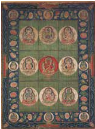
【1】重要文化財 愛染曼荼羅 日本・鎌倉時代 13世紀 根津美術館蔵