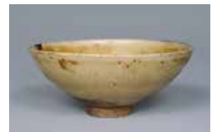
【7】珠光青磁茶碗 銘 遅桜 同安窯系 中国・南宋時代 13世紀 根津美術館蔵