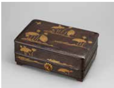
【5】蓮池蒔絵経箱 日本・平安時代 12世紀 根津美術館蔵