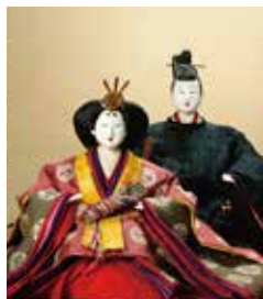
【6】内裏雛 日本・明治時代 19世紀 根津美術館蔵 竹田恆正氏寄贈