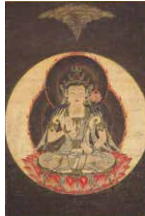
【3】重要美術品 聖観音像 日本・鎌倉時代 13世紀 根津美術館蔵