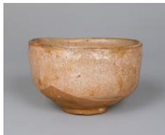
【5】紅志野茶碗 桃山時代 16世紀 根津美術館蔵