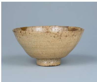
【2】重要美術品 大井戸茶碗 銘 三芳野 朝鮮・朝鮮時代 16世紀 根津美術館蔵