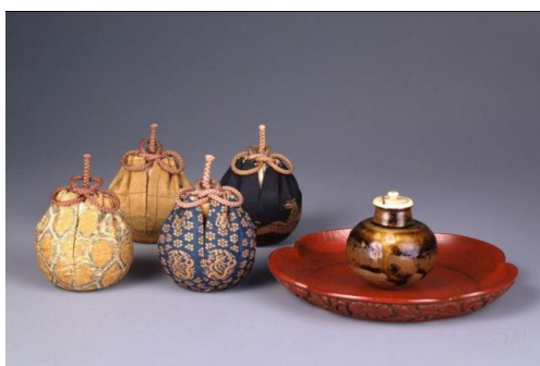
【1】重要文化財 丸壺茶入 銘 相坂 瀬戸 南北朝～室町時代 14-15世紀 根津美術館蔵