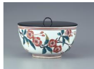
【8】色絵桜花文水指 肥前 江戸時代 17世紀 根津美術館蔵