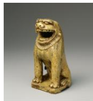
【3】重要美術品 獅子香炉 瀬戸 室町時代 16世紀 根津美術館蔵