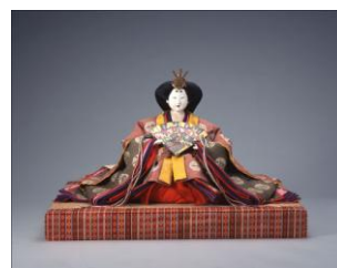
【7】女雛(内裏雛のうち) 明治時代 19世紀 根津美術館蔵 (竹田恒正氏寄贈)