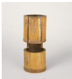
【4】輪無二重切花生 銘 再来 小堀遠州作 江戸時代 17世紀 根津美術館蔵