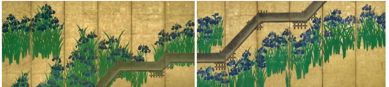
八橋図屏風 六曲一双 尾形光琳筆 江戸時代 18世紀 メトロポリタン美術館蔵

根津美術館では、開館70周年を記念して、2011年春、メトロポリタン美術館（米国・ニューヨーク市）所蔵の「八橋図屏風」と当館が誇る国宝「燕子花図屏風」を一堂にご覧いただく開館70周年記念特別展『KORIN展 国宝「燕子花図」とメトロポリタン美術館所蔵「八橋図」』を開催する運びとなりました。