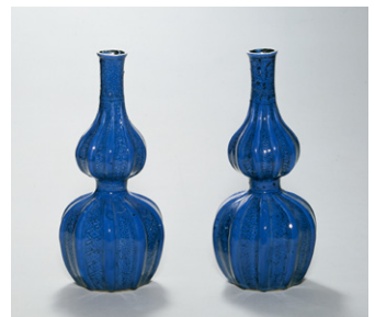
【5】祥瑞瑠璃釉瓢形徳利 景德鎮窯 2口 施釉磁器 中国・明時代 17世紀 根津美術館蔵