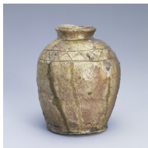
【4】蹲花入 信楽または伊賀 1口 無釉陶器 日本・室町～桃山時代 16世紀 根津美術館蔵