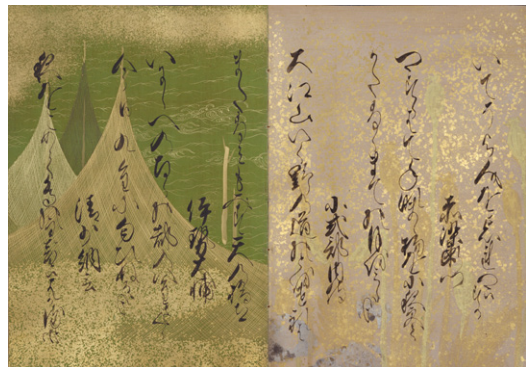
【2】百人一首帖 智仁親王筆 1帖 彩箋墨書 日本・江戸時代 17世紀 根津美術館蔵