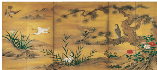
【6】花鳥図(右隻) 芸愛筆 日本・室町時代 15～16世紀 根津美術館蔵