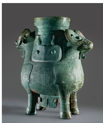
【1】双羊尊 中国・おそらく湖南省 紀元前13～11世紀 英国・大英博物館蔵

■ 広報画像をデータでご用意しております。ご希望の写真番号に○を付けてください。