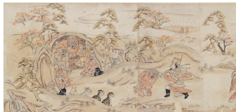
【5】重要文化財 十二因縁絵巻(部分) 日本・鎌倉時代 13世紀 根津美術館蔵