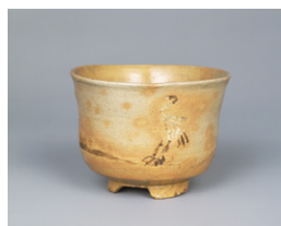
【8】御本立鶴茶碗 高麗茶碗 朝鮮・朝鮮時代 17世紀 根津美術館蔵