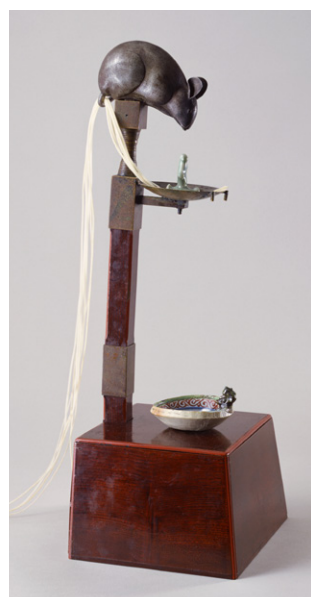
【4】鼠短檠 日本・江戸時代 18～19世紀 根津美術館蔵