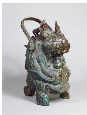
【3】重要美術品 虎卣 中国・西周時代 紀元前11世紀 京都・泉屋博古館蔵