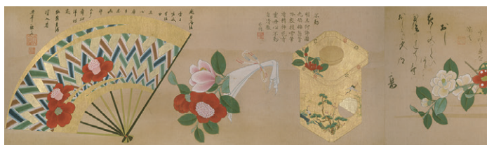
【7】百椿図 伝 狩野山楽筆 2巻のうち本之巻(部分) 日本・江戸時代 17世紀 茂木克己氏寄贈 根津美術館蔵