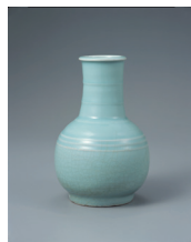
【8】青磁竹子花入 龍泉窯 中国・南宋時代 13世紀 根津美術館蔵