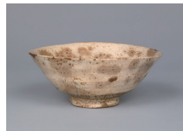
【5】重要美術品 雨漏茶碗 銘 蓑虫 朝鮮・朝鮮時代 16世紀 根津美術館蔵