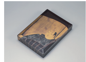
【6】業平時絵硯箱 伝 尾形光琳作 日本・江戸時代 18世紀 根津美術館蔵