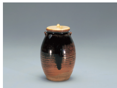
【4】膳所耳付茶入 銘 大江 膳所 日本・江戸時代 17世紀 根津美術館蔵