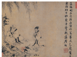
【7】国宝 布袋蔣摩訶問答図 因陀羅筆 楚石梵琦賛 中国・元時代 14世紀 根津美術館蔵