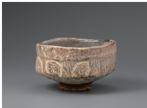
【3】重要文化財 鼠志野茶碗 銘 山の端 美濃 日本・桃山～江戸時代 17世紀 根津美術館蔵