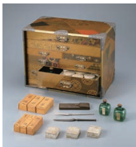
【2】 百草蒔絵葉筆筒 飯塚桃葉（初代）作 日本・江戸時代 明和8年（1771） 根津美術館蔵