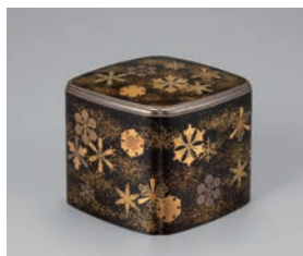
【3】 雪華蒔絵箱 日本・江戸時代 19世紀 根津美術館蔵