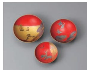
【4】 雪月花三社蒔絵朱盃 原羊遊斎作・酒井抱一下絵 日本・江戸時代 19世紀 根津美術館蔵