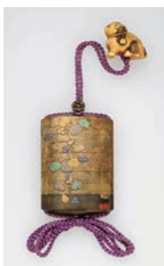
【5】 御簾葵蒔絵印籠 銘 梶川作 日本・江戸時代 19世紀 根津美術館蔵