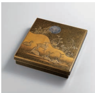
【1】 重要文化財 春日山蒔絵硯箱 日本・室町時代 15世紀 根津美術館蔵