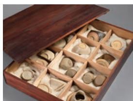
【6】 陶片 京都 御室 日本・江戸時代 17世紀 根津美術館蔵