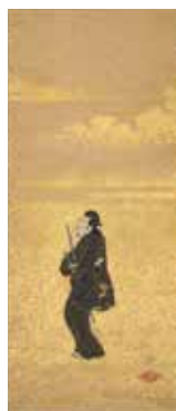
重要美術品 風俗図 日本・江戸時代 17世紀 根津美術館蔵