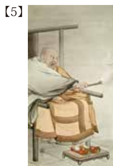
臨濟一喝 橋本雅邦筆 日本・明治時代 明治30年(1897) 個人蔵