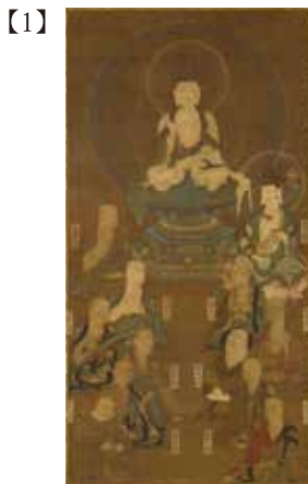
重要文化財 法相曼荼羅 日本・鎌倉時代 13～14世紀 根津美術館蔵