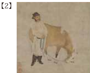
重要美術品 飼馬図 賢江祥啓筆 日本・室町時代 15世紀 根津美術館蔵 小林 中氏寄贈