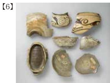
粉青陶片 朝鮮・朝鮮時代 15～16世紀 根津美術館蔵