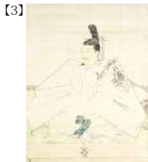
伝藤原光能像 模本 冷泉為恭筆 日本・江戸時代 19世紀 根津美術館蔵 植村和堂氏寄贈