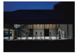
【4】 夜間開館