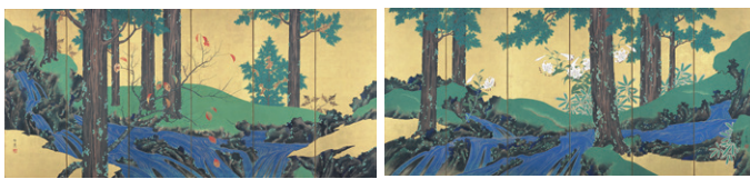
【3】 重要文化財 夏秋溪流図屏風 鈴木其一筆 日本・江戸時代 19世紀 根津美術館蔵