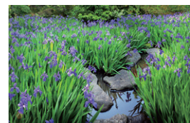
【5】 庭園内のカキツバタ