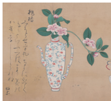
【7】 百椿図 伝 狩野山楽筆 日本・江戸時代 17世紀 根津美術館蔵 茂木克己氏寄贈