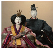
【6】 内裏雛 日本・明治時代 19世紀 根津美術館蔵 竹田恆正氏寄贈