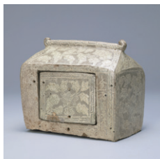
【2】 粉青牡丹文厨子 朝鮮・朝鮮時代 15世紀 根津美術館蔵