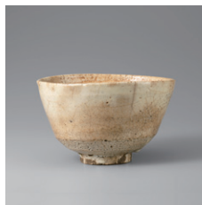
【5】 奥高麗茶碗 銘 二見 日本・桃山～江戸時代 16～17世紀 個人蔵