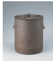
【8】 雲龍金 日本・江戸時代 17世紀 根津美術館蔵

その他の画像のご希望: ※上記「広報画像」以外の画像、ポスター画像をご要望の際は、その旨お書きください。