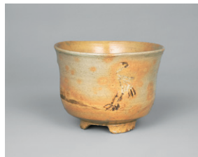
【3】 御本立鶴茶碗 朝鮮・朝鮮時代 17世紀 根津美術館蔵