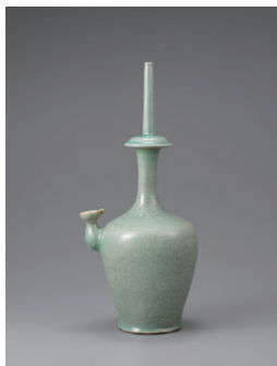
【1】 重要文化財 青磁蓮華唐草文浄瓶 朝鮮・高麗時代 12世紀 根津美術館蔵