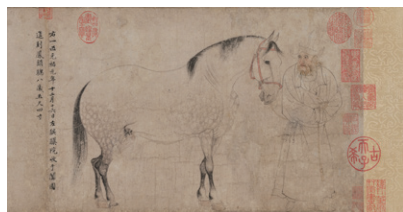
【1】重要美術品 五馬図巻（部分）李公麟 中国・北宋時代 11世紀 東京国立博物館蔵

以下の広報画像の取扱いに関する規定に承諾の上、画像申請を行います。 ・広報画像の使用は「根津美術館」を紹介する場合に限りです。事前の申請・承諾なく二次利用いたしません。 ・広報画像を紹介する場合には、指定されたクレジットを併記します。 ・トリミング、変形、部分使用、切り抜き、文字のせは無断で行いません。