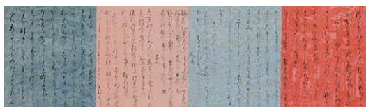
【5】国宝 古今和歌集序（卷子本）（部分） 日本・平安時代 12世紀 東京・大倉集古館蔵 ※【前期と後期で巻替え】