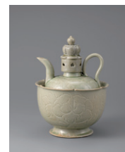
【6】青磁牡丹文水注・承盤 中国・北宋時代 11世紀 個人蔵（根津美術館寄託）

その他の画像のご希望： ※上記「広報画像」以外の画像、ポスター画像をご要望の際は、その旨お書きください。