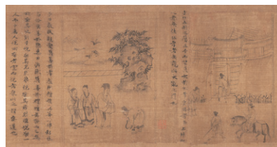
【2】孝経図巻（部分）李公麟 中国・北宋時代 元豊8年（1085）頃 アメリカ・メトロポリタン美術館蔵