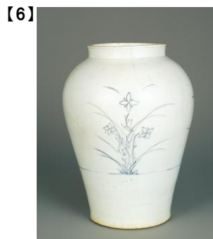
重要文化財 青花秋草文壺 朝鮮・朝鮮時代 18世紀 根津美術館蔵 [秋山順一氏寄贈]