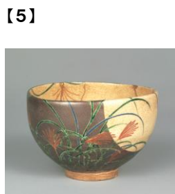
重要美術品 色絵武蔵野茶碗 野々村仁清作 江戸時代 17世紀 根津美術館蔵 [初代根津嘉一郎蒐集]