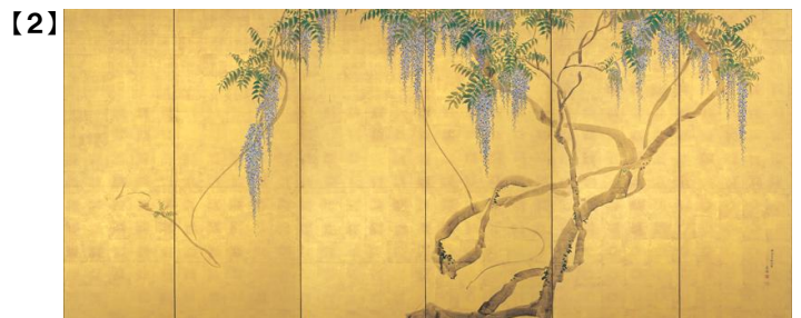
重要文化財 藤花図屏風 (右隻) 円山応挙筆 江戸時代 安永5年 (1776) 根津美術館蔵 [初代根津嘉一郎蒐集]