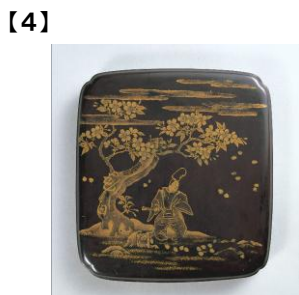
重要文化財 花白河蒔絵硯箱 室町時代 15世紀 根津美術館蔵 [初代根津嘉一郎蒐集]