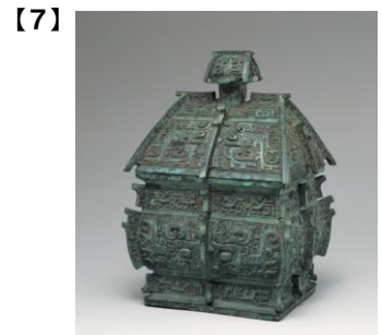
重要文化財 饗養文方彝 中国・西周時代 前10世紀 根津美術館蔵 [初代根津嘉一郎蒐集]