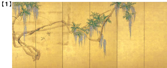
重要文化財 藤花図屏風 (左隻) 円山応挙筆 江戸時代 安永5年 (1776) 根津美術館蔵 [初代根津嘉一郎蒐集]

広報画像をデータでご用意しております。希望される写真の番号に○を付けてください。