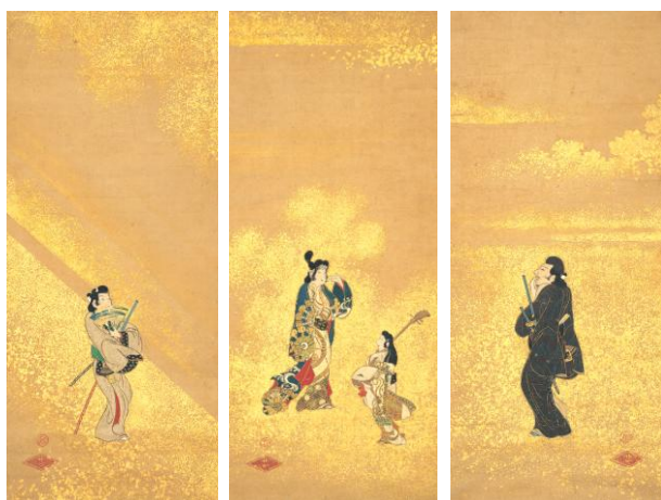
重要美術品 風俗図 3幅 江戸時代 17世紀 根津美術館蔵