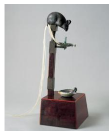
鼠短檠 江戸時代 19世紀 根津美術館蔵