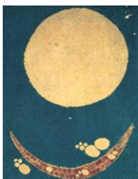
円に花葉模様裂 (辻が花) 桃山時代 16世紀 根津美術館蔵