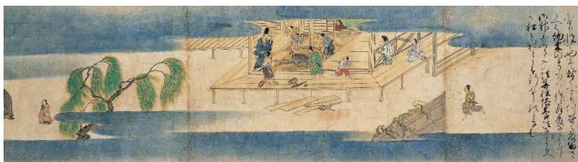
蛙草紙絵巻 1巻 伝 土佐光信筆 室町時代 16世紀 根津美術館蔵