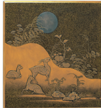
【4】 重要文化財 春日山蒔絵硯箱 日本・室町時代 15世紀 根津美術館蔵