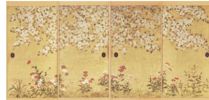
【2】 桜芥子図襖 伊年印 日本・江戸時代 17世紀 大田区立龍子記念館蔵