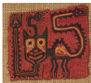
【6】 裂 フェリーノ模様 ペルー・パラカス文化 紀元前2～前1世紀 根津美術館蔵