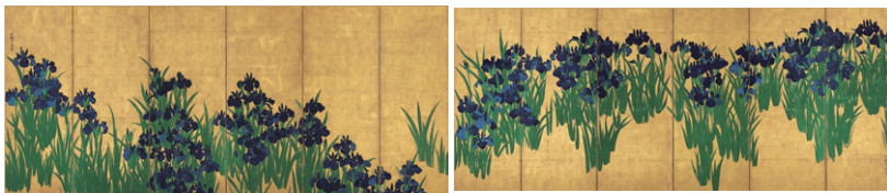
【1】 国宝 燕子花図屏風 尾形光琳筆 日本・江戸時代 18世紀 根津美術館蔵