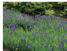
【8】 庭園内のカキツバタ