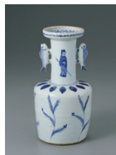
【7】 古染付鯉耳高砂花入 景德鎮窯 中国・明時代 17世紀 根津美術館蔵