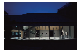
【9】 2024年5月8日～12日 夜間開館

その他の画像のご希望: ※上記「広報画像」以外の画像、ポスター画像をご要望の際は、その旨お書きください。