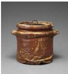
【6】 矢筈口水指 銘 黙雷 備前 日本・桃山～江戸時代 17世紀 根津美術館蔵