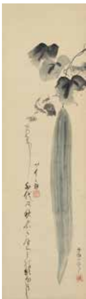
【5】 糸瓜図 中村芳中筆、川上太白賛 日本・江戸時代 寛政12年(1800) 個人蔵