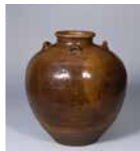
【8】 茶壺 銘 四国猿 福建省系 中国・元時代 14世紀 根津美術館蔵