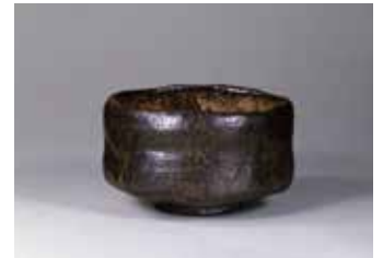
【3】 黒楽茶碗 紙屋黒 長次郎作 日本・桃山時代 16世紀 静嘉堂文庫美術館蔵