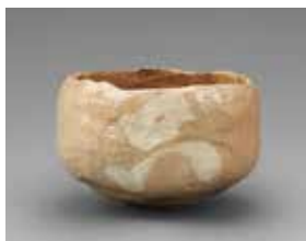
【1】 赤楽茶碗 銘 只 川上太白作 日本・江戸時代 18世紀 個人蔵

以下の広報画像の取扱いに関する規定に承諾の上、画像申請を行います。 ・広報画像の使用は「根津美術館」を紹介する場合に限りです。事前の申請・承諾なく二次利用いたしません。 ・広報画像を紹介する場合には、指定されたクレジットを併記します。 ・トリミング、変形、部分使用、切り抜き、文字のせは無断で行いません。