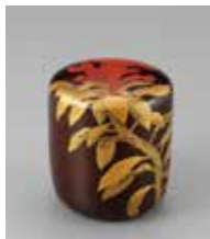
【4】 鶏頭蒔絵棗 塩見小兵衛作 日本・江戸時代 18世紀 個人蔵