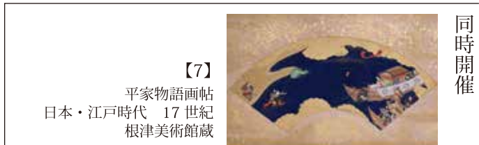
【7】 平家物語画帖 日本・江戸時代 17世紀 根津美術館蔵