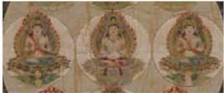
重要文化財 金剛界八十一尊曼荼羅(部分) 鎌倉時代 13世紀

気品漂う如来、柔和な菩薩、憤怒の明王—根津美術館が誇る絵画・彫刻の名品を一堂に展示。