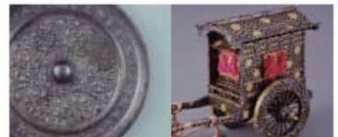
唐草文鏡 中国・唐時代 7世紀 蒔絵雑道具(牛車) 明治時代 19世紀

中国・漢～元時代にわたる鏡の名品と、旧皇族の名家に伝わった雑道具を初披露いたします。