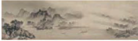
国宝 漁村夕照図 牧谿筆 中国・南宋時代 13世紀

「胸中の山水」に画家の心とともに遊び、「魂の書」に禅僧の精神を感じ取ってください。