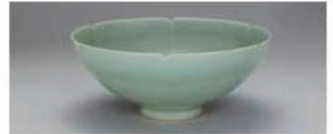
青磁輪花鉢 中国・南宋時代 12世紀