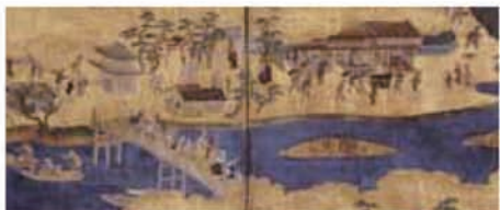
宇治橋図屏風(部分) 桃山時代 16-17世紀

中世の絵巻から桃山・江戸時代の屏風絵、岩佐又兵衛や宮川長春まで、秘蔵コレクションを公開。