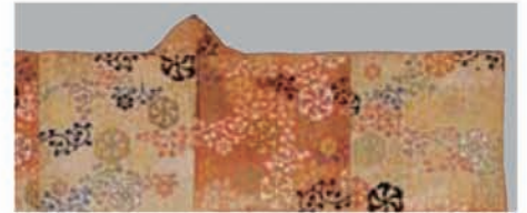
紅薄縹段鉄織花唐草模様唐織(部分) 江戸時代 18世紀

あかいのうえ しほじょう 「葵上」や「狸々」など、役をあらわす能面・能装束約30点を展覧します。