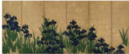
国宝 燕子花図屏風(左隻) 尾形光琳筆 江戸時代 18世紀

尾形光琳の代表作、国宝「燕子花図屏風」が、4年ぶりに根津美術館の初夏を彩ります。