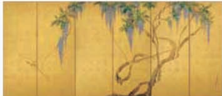
重要文化財 藤花図屏風(右隻) 円山応挙筆 江戸時代 安永5年(1776)

新創記念特別展の締めくくりとして、コレクション形成の過程とその全貌をご覧にいたします。